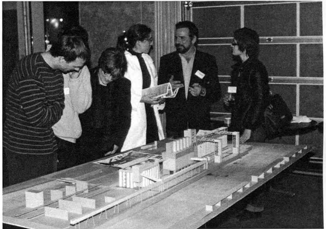
L'exposition des projets de la Charrette d'architecture organisée par Docomomo Québec les 30 septembre et 1 er octobre 2000.

Le Forum a débuté par une présentation des organismes et individus engagés dans l'événement et était suivi du vernissage de l'exposition des travaux de la Charrette d'architecture. La présentation de l'Aqpi a été fait par